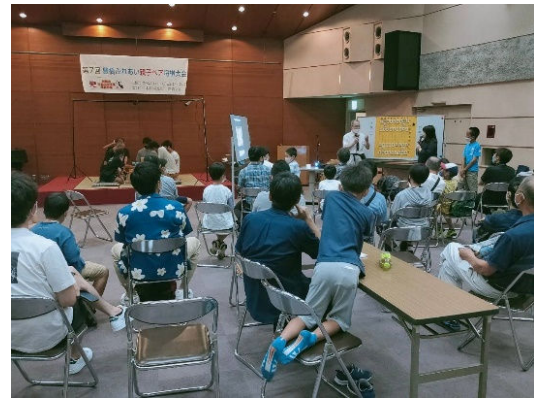
公開対局 大盤 解説