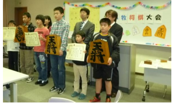
写真など コピー転載を禁ずる