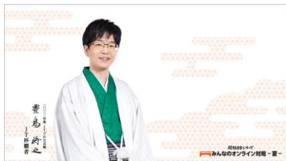
(参加賞)豊島将之JT杯覇者壁紙