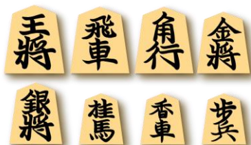
将棋駒型消しゴム