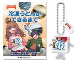
「冷凍うどんができるまで」のマンガ小冊子と「コシノツヨシのキーホルダー」のセット