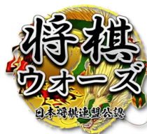
将棋ウォーズ プレミアム会員権