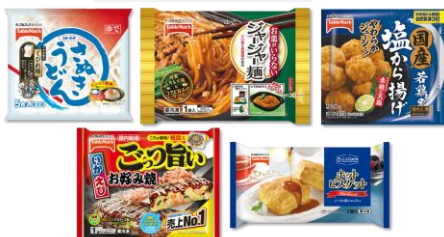
テーブルマーク冷凍食品詰め合せ ※パッケージは変更になる可能性があります。