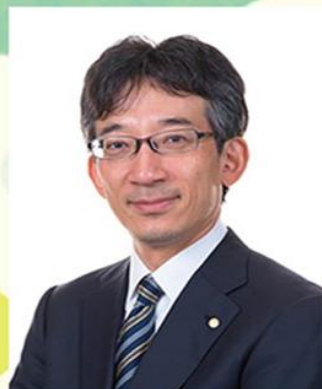
日本将棋連盟 会長 佐藤康光 九段