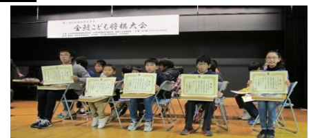
各クラス優勝の皆さん 左から知事賞の名人戦AとBCDE

■各クラス優勝者には 副賞として 三輪基盤店さんから 素敵な盤が おられました。