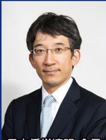
日本将棋連盟 会長 佐藤康光 九段