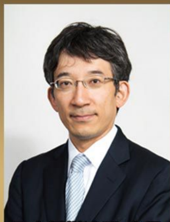
日本将棋連盟 会長 佐藤康光 九段