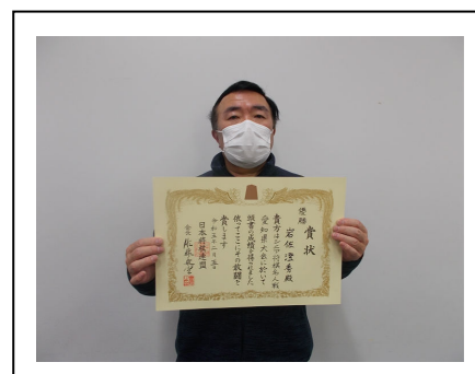
<シニア名人戦優勝者>