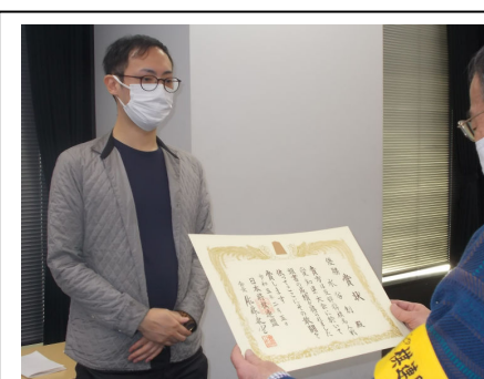
<支部名人戦優勝者>