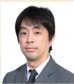
久保 利明 王将