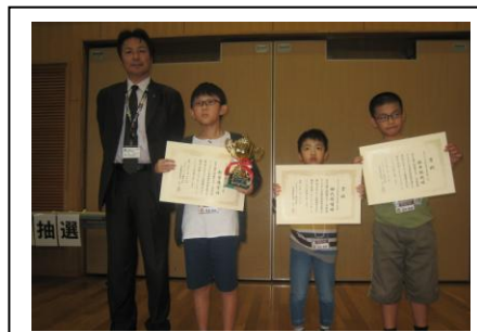
<Bクラスジュニア銀河戦代表選抜戦>