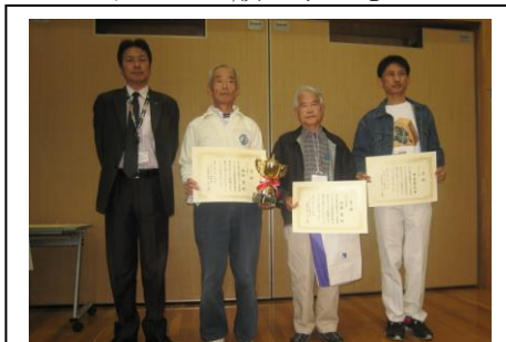
<Cクラス 一般・子ども>