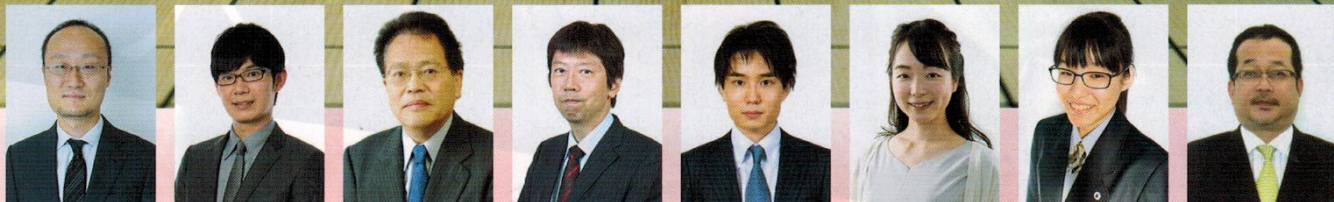
渡辺明 名人 斎藤慎太郎 八段 石田和雄 九段 杉本昌隆 八段 佐々木勇気 七段 室田伊緒 女流二段 山口仁子梨 女流二級 中山則男 六段