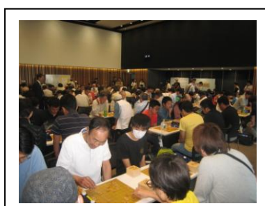
A組・B組・C組(一般の部)